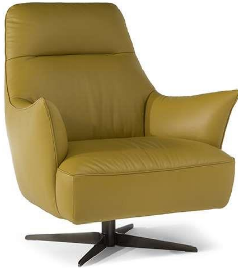
■ Vers. 066