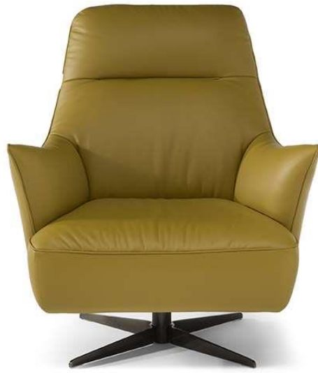
■ Vers. 066